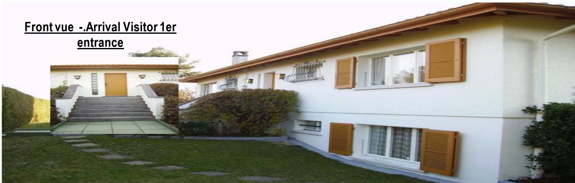
Front vue - Arrival Visitor 1er entrance

En exclusivité .: Propriété à louer dès juillet 2012 ou entrée à convenir. House non furnish Monthly rental CHF 8'795.00 (+ charges = CHF 875.- = Gardner - Internet - TV Taxe Central Heat. - House Furnish monthly rental CHF 14.878,50.- (+) charges = CHF 875.00